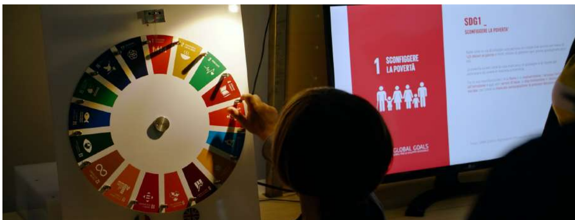
Laboratorio | Agenda 2030

L'offerta didattica del MACa prevede la visita guidata delle gallerie e 36 attività laboratoriali sui temi della sostenibilità, declinate per temi (acqua, energia, scarti, alimentazione, trasporti) e fascia d'età (dalla scuola dell'infanzia alla secondaria di secondo grado).