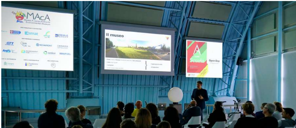
Open Day 2019 | 21 settembre 2019

A fine settembre 2019, durante l' Open Day 2019 , un intero pomeriggio è stato dedicato agli insegnanti e alle loro famiglie, durante il quale i Pilot del Museo hanno accompagnato gli ospiti lungo i percorsi espositivi e il Direttore del MACA ha illustrato i laboratori in catalogo per l'anno scolastico 2019-20, lanciando così le attività didattiche per l'anno scolastico appena iniziato.