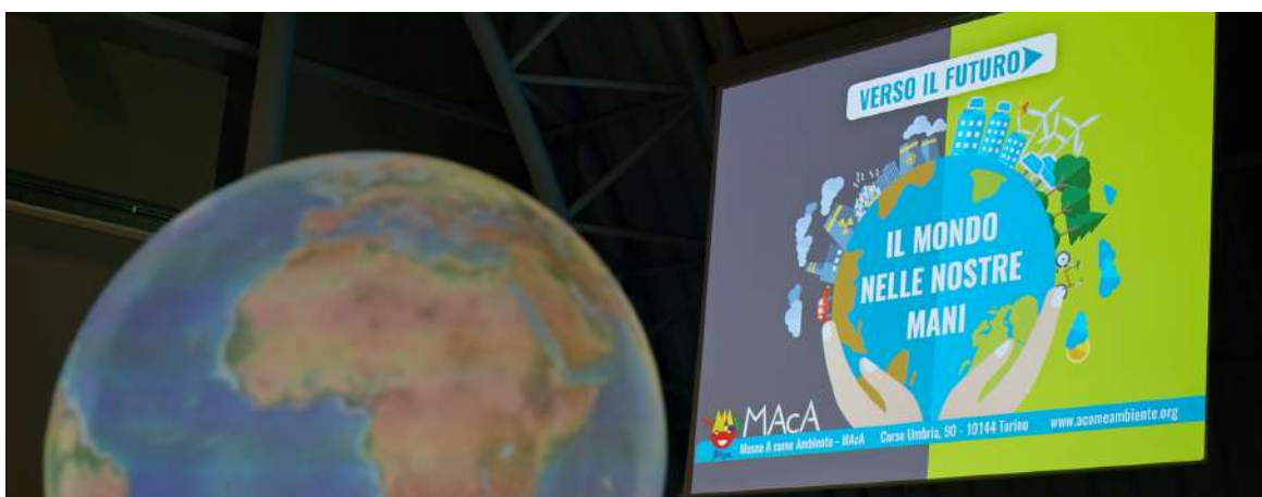
Padiglione Guscio | Mostra Verso il Futuro

nell'esercizio ha avuto luogo la prima mostra temporanea ideata e progettata internamente, ospitata all'interno del Padiglione Guscio, ed è altresì proseguito il piano di rilancio dell'offerta didattica ed educativa e del riposizionamento culturale del MACA in accordo con il Piano Strategico triennale. Nel 2019 il Museo è stato visitato da circa 34.600 persone , tra scuole e pubblico generale.